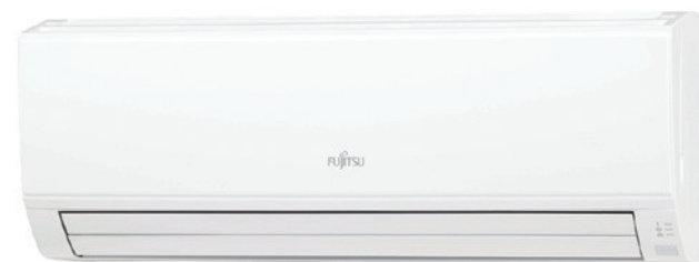
ASY 50-71 UI-KL