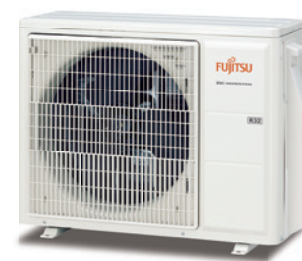
ASY 50-71 UI-KL